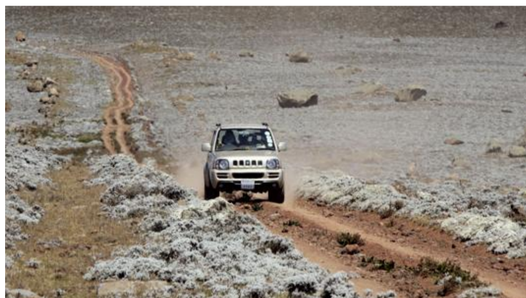
Un véhicule tout-terrain est indispensable pour sillonner le plateau montagneux du Sanetti. Constitué de roches volcaniques, il est recouvert d'une multitude d'espèces de lichens et de larges étendues de coussinets d'immortelles argentées qu'on voit sur la photo.

Le lendemain, nous sommes à nouveau debout avant le soleil. Soulevant des nuages de poussière, notre jeep cahote sur la piste