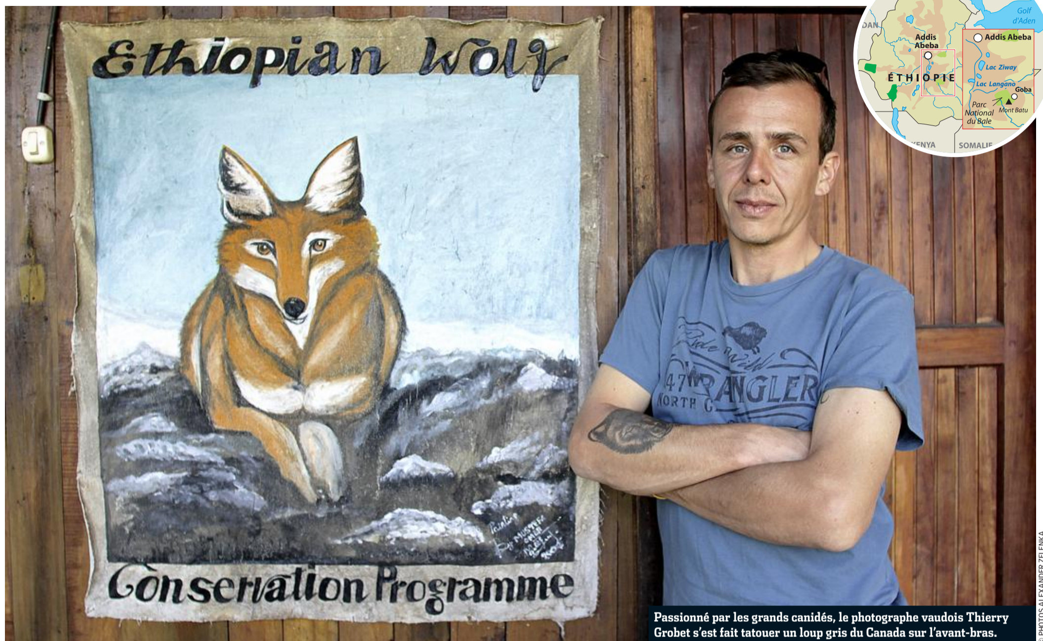
Passionné par les grands canidés, le photographe vaudois Thierry Grobet s'est fait tatouer un loup gris du Canada sur l'avant-bras.