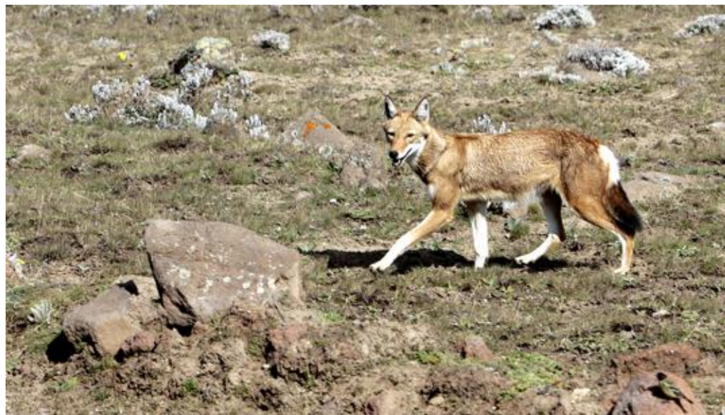
Le loup d'Ethiopie ( Canis simensis ) est le carnivore le plus menacé d'Afrique. Les représentants de l'espèce sont au nombre de 500, ce qui explique qu'ils soient classés en danger sur la liste rouge de l'Union internationale pour la conservation de la nature.

Debre Zeyit, Mojo, Alem Tena... A chaque nouveau village, nous ralentissons l'allure. L'atmosphère est bien plus détendue qu'à Addis-Abeba. Chacun de nos arrêts provoque